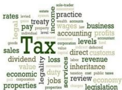
Words associated with 'Tax'.